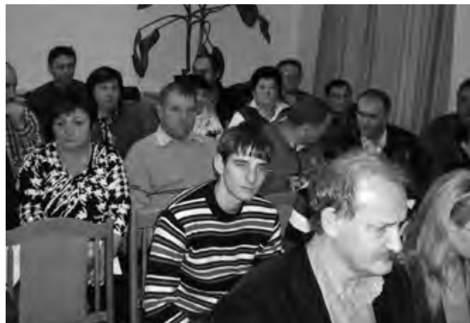
Sa konferencije u Segedinu