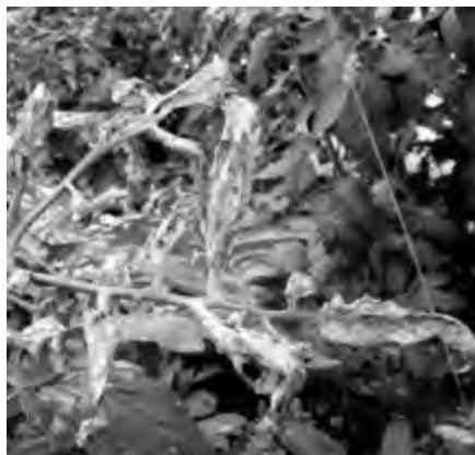
Štetočine na listu (Ivanović)