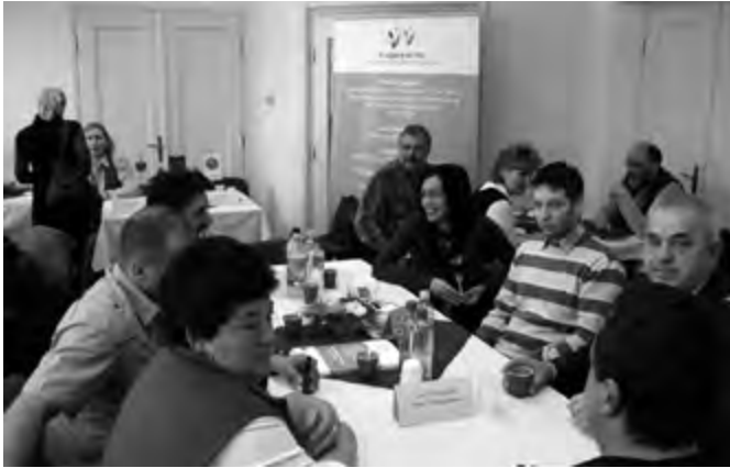
Susret preduzetnika u „Nepkeru”

ti kod sebe legitimaciju praproizvođača, kao i dnevnik prskanja, pomoću kojeg se može proveriti, kada i kojim hemikalijama su tretirani ponuđeni proizvodi. Izložena roba nikako ne sme sadržati strane materije /npr. na peršunu ili krompiru ne sme biti ni zemlje ni drugih nečistoća/. U Evropskoj uniji strogi propisi regulišu kvalitet hrane, pa je između ostalog govorio o propisima, koji se odnosi na kvalitet kivija. U slučaju ovog voća masa ploda ekstra kvaliteta ne sme biti niža od 90 gr, kod prve klase 70 g, a kod II klase ispod 65 gr po plodu. Dakle, prostom računom broja plodova kupac može ustanoviti, koju