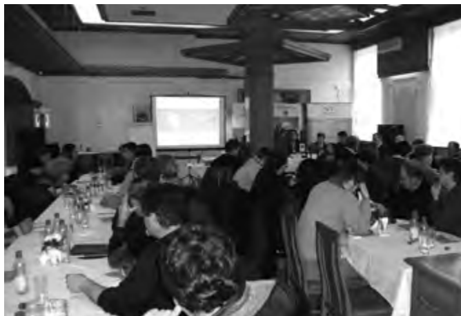
Učesnici skupa u „Nepkeru”

Jačanje privredne saradnje na planu integralne poljoprivredne robne ponude u pograničnom prostoru Srbije i Mađarske” je naziv projekta, koji zajedno realizuju lokalne samouprave Subotice i grada Segedina iz Mađarske, zatim JKP „Subotičke pijace” i Veletržnica iz Kiskundorőzme. Cilj projekta iz IPA prekograničnog programa Mađarska-Srbija je razmena iskustava, harmonizacija trgovine, stvaranje integralne poljoprivredne robne ponude, širenje ponude organskih proizvoda na pijacama, promocija i realizacija obrazovanja.